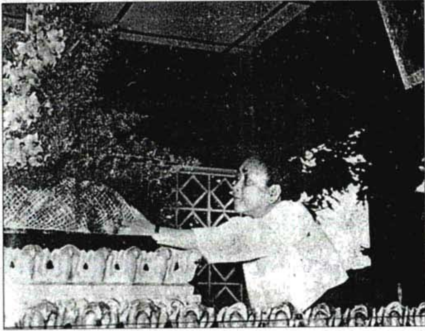
ဗိုလ်ချုပ်အောင်ဆန်းရုစိမာန်တွင် လွမ်းသွပ်နှင်းခြင်းရုစနုခသာ ဒေါ်ခင်ကြည်

“နိုင်ငံရေး သိပ်မလိုက်ပါနဲ့၊ ဒုက္ခတွေ့ ရတတ်တယ်လို့ ကျွန်မ ပြောတော့ မဟုတ်တာ မခင်စော ရယ်၊ ရှေးလူကြီးတွေ ကိုယ်တို့ အတွက် လုပ်ခဲ့ရင် နောက်လူတွေ အတွက် ကိုယ်တို့ လုပ်ပေးဖို့ဟာ တာဝန်ရှိတယ်လို့ အထပ်ထပ်ပြော ခဲ့တယ်။ သူဟာ လူအေး တစ် ယောက်ပဲ။ အတော်လည်း သည်းခံ နိုင်တယ်။ ကိုယ်ကိုယ်တိုင်ကလည်း “စင်ကြယ်ရမယ်လို့ တဖွဖွ ပြော တတ်တာပဲ။ သူတို့သာရှိမယ်ဆိုရင် တိုင်းပြည်မှာ တွေ့နေရတဲ့ ဒုက္ခ သူတွေမျိုး အိပ်မက်တောင် မက် မိမှာမဟုတ်ဘူး” ဦးဘဝင်း အေး သလောက် ဒေါ်ခင်စောမှာ ရေခဲမှာ နှင်းဆောင်းထားသလို ရှိတို၏။ “စကား လုံပါစေတဲ့၊ စိတ် ထိန်းပါတဲ့၊ သားမယားကို အဲဒီ စကားနဲ့ပဲ ဆုံးမတယ်။ မွေးချင်း တွေနဲ့ မတည့်ချင်နေပါစေ၊ အမေ ကိုတော့ တည့်အောင်ပေါင်းပါလို့ ခဏခဏ သတိပေးရှာပါတယ်။ သားသမီးတွေကိုသိပ်သည်းညည်း ခံတာပါပဲ။ အစားအသောက်လည်း ချေးမများဘူး၊ အသားကြော်လေး တစ်ခွက်ပါရင် ပြီးတာပဲ” ဒေါ်ခင် စောသည် ဦးဘဝင်း အကြောင်း ဟောင်းကလေးများကို စဉ်လျက် သိလျက် ထုတ်ဖော်ပြောကြားခဲ့ရာ ပါသည်။ “နိုင်ငံရေး လုပ်တာဟာ အသက်ကို တိုတာတော့အမှန်ပဲ” လို့ဒေါ်ခင်စောမှတ်ချက်ချခဲ့ဖူးသည်။