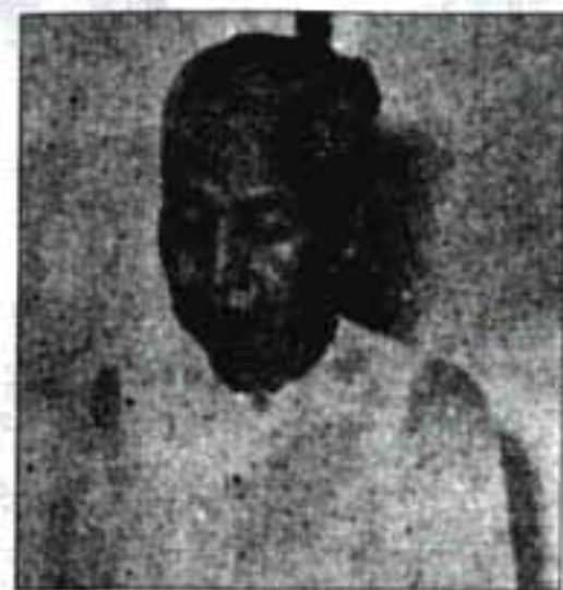
ဦးဘဝင်း၏ ဝန်ကြီး ဦးရာဇဝတ်၏ ဝန်ကြီး

ဒေါ်ခင်ခင်မှာ ဗိုလ်ချုပ်ဈေး ဒေါ်ခင်ခင် ကုမ္ပဏီနှင့် မန္တလေး